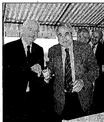
Un moment de détente avec dégustation de saucisson à l'ail.

Les principales entreprises : IRH (Bureau d'études), La Saur adjudicataire du marché, BTP Val du Cher pour le Génie Civil, Exeau Centre pour le terrassement.