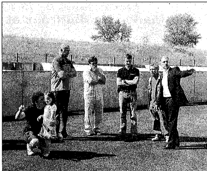
Explications lors des portes ouvertes